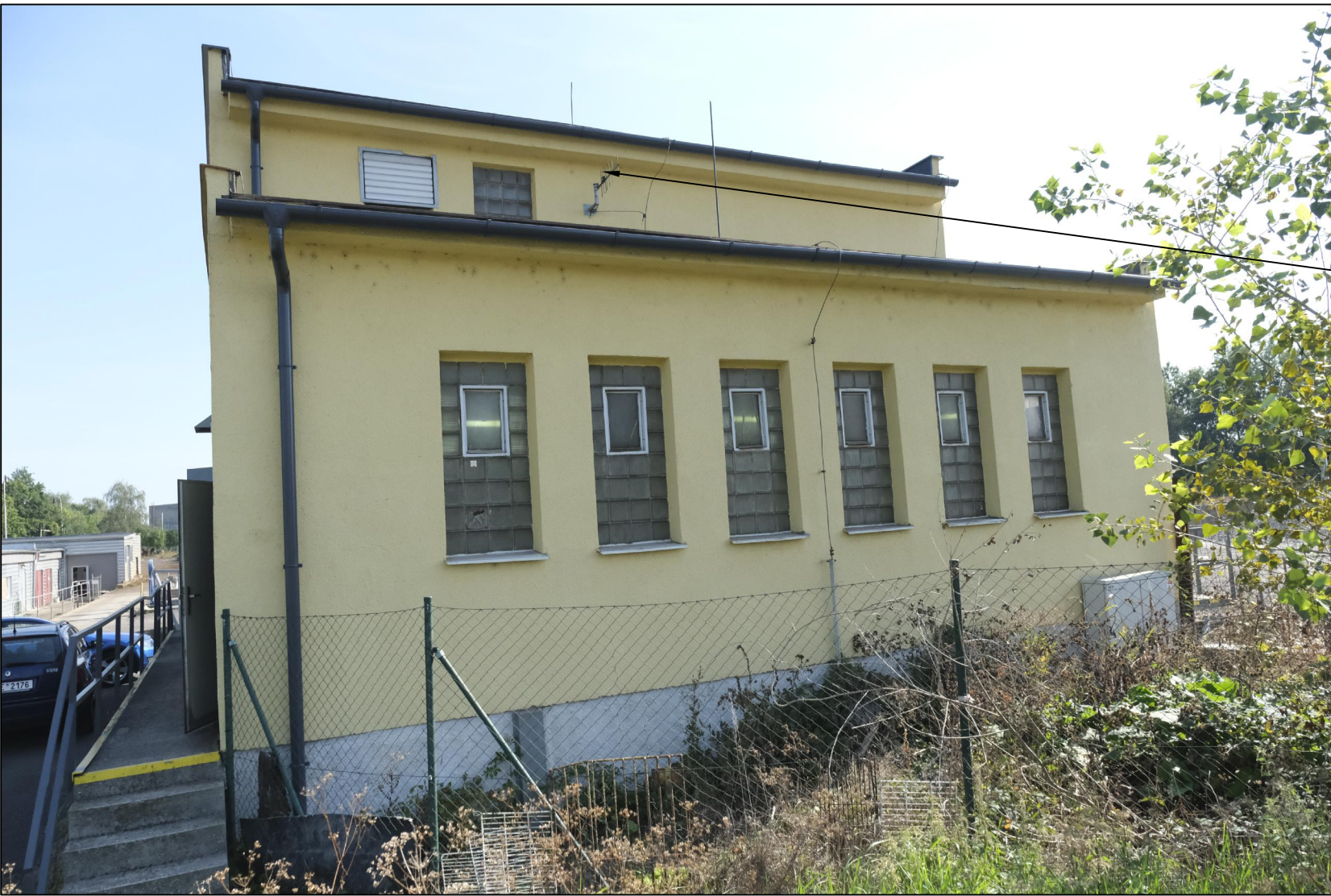
Demontáž venkovní antény v rámu PS06, demontáž koaxiálního kabelu včetně lišty.